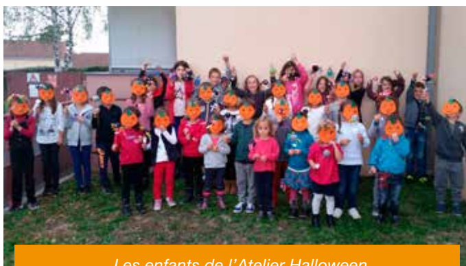
Les enfants de l'Atelier Halloween