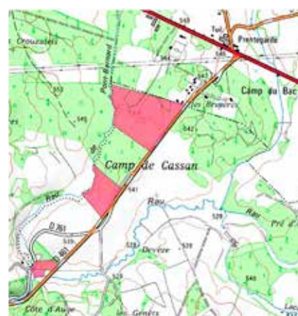
Parcelles en rouge en mesures compensatoires RD120

Phase chantier. L'an dernier, cette lettre d'information revenait sur la dépollution de l'ancienne décharge. Aujourd'hui celle-ci est en voie de revégétalisation naturelle. Les botanistes du CEN Auvergne l'observent de près. En fonction de la végétation spontanée, ce site sera remis en pâturage ou laissé en libre évolution pour devenir une forêt riveraine.