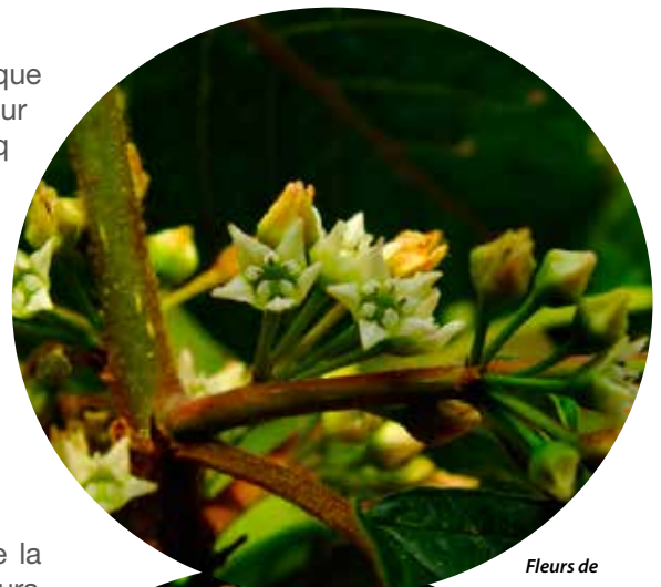
Fleurs de la Bourdaine

DREAL Auvergne- Rhône-Alpes 7 rue Léo Lagrange 63 033 Clermont-Fd Tél. 04 73 43 16 00 www.auvergne-rhone-alpes.developpement-durable.gouv.fr