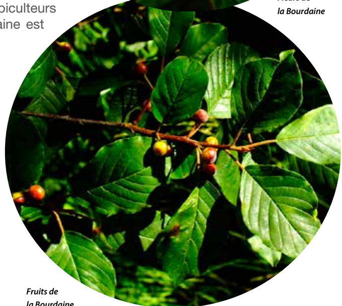
Fruits de la Bourdaine